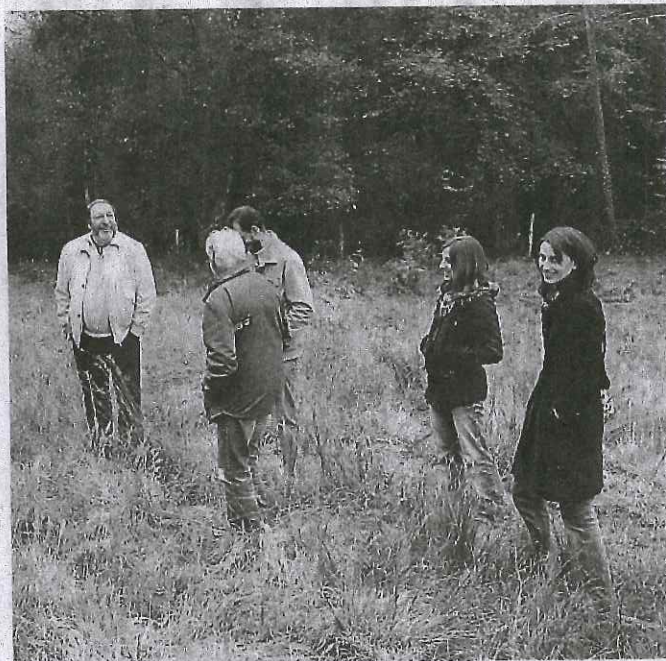
La tourbière de Cuguron lors d'une journée étude.

Le mardi 2 février à 20 h 30 au cinéma associatif « Les variétés » à Montréjeau (7, place de Verdun 31 210 Montréjeau), à l'occasion de la Journée Mondiale des Zones Humides, l'association AREMIP et la Cellule d'Assistance Technique Zones humides des Pyrénées centrales organisent une soirée projection débat sur le